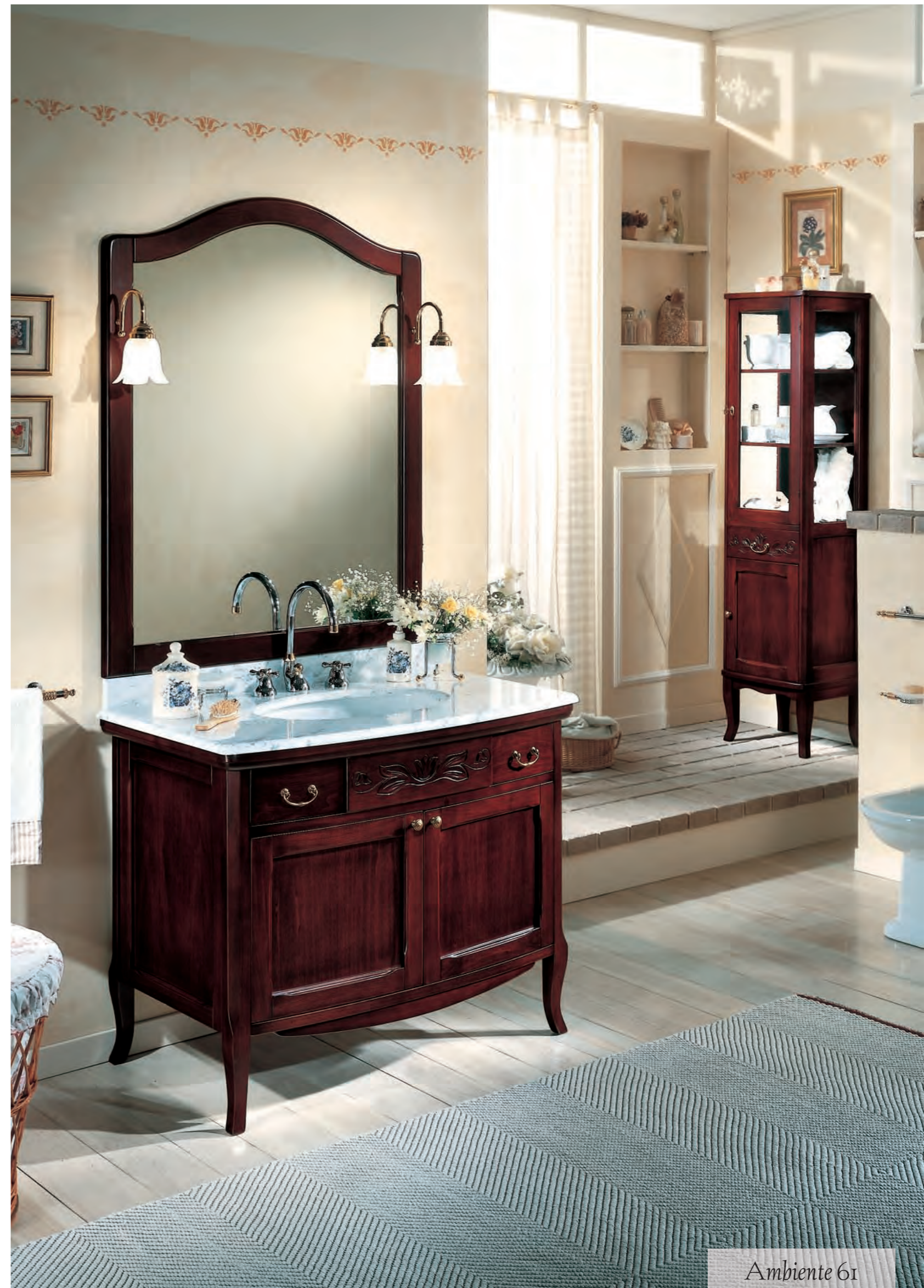
Ambiente 61 dim. 101x205x60

PRODUCING A CLASSIC PIECE OF FURNITURE TODAY IS NOT ONLY A STYLE TRAINING, BUT ALSO THE CREATION OF SERENE ATMOSPHERES. THE PROJECTS ARE LINKED TO A STILL STRONG MEMORY, BOTH IN DESIGN AND IN PARTICULARS, WHERE TIME PLAYS VALUES OF ESSENTIAL PROTAGONISM.